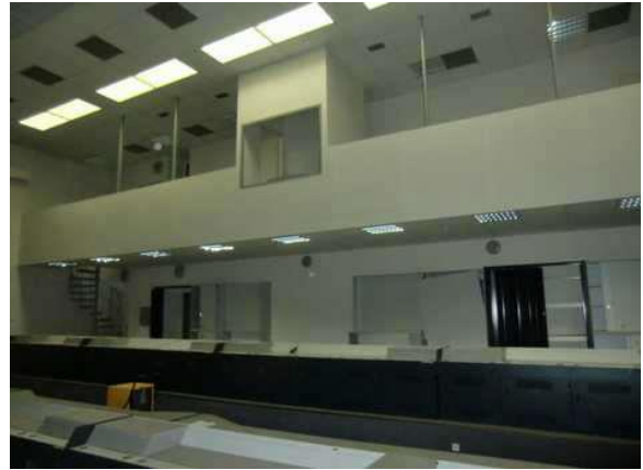
interiér obj. 03