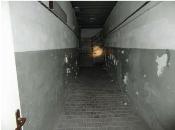
interiér obj. 03