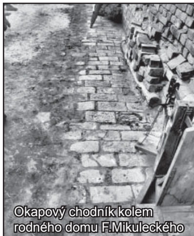
Okapový chodník kolem rodného domu F.Mikuleckého