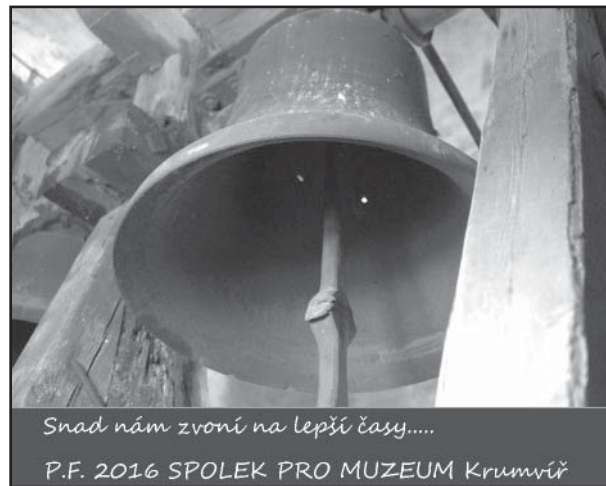
Snad nám zvoní na lepší časy.....